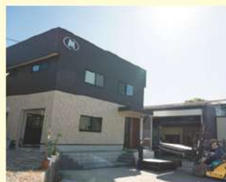
株式会社メイキ産業 本社

メイキ産業では、設備・機材・工具・会社や工場でする物品の販売をしています。ネジ1本から精密な機材まで、製造現場でする全てのものを取り扱っています。また、岡本鉄工では、部品や工場の設備、機材を作っています。依頼を受けた会社のために世界にひとつだけの商品を製作します。